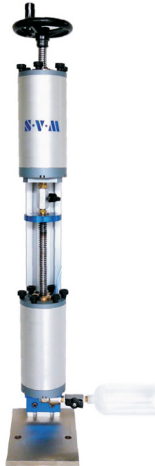
Débulleur UNIDOSE 888-500